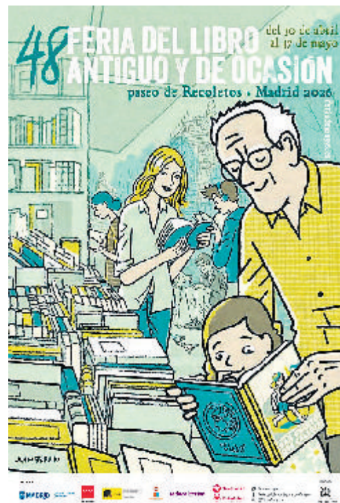
El cartel de la Feria del Libro Antiguo de este año en sus dos versiones