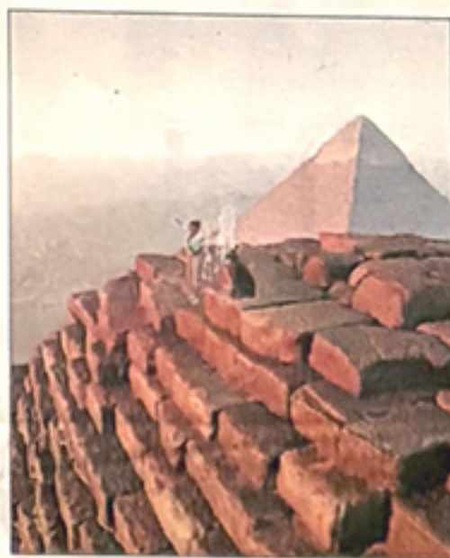
Una de las escenas de la visita. E.M.

La expedición es una oportunidad para ver la Gran Pirámide de una forma no permitida en el mundo real. Se puede caminar por pasadizos estrechos y estancias como la Cámara del Rey y de la Reina, espacios recreados con un detalle que casi permite notar la textura de los bloques de piedra bajo los pies. Pero el viaje no se limita a los interiores; también incluye un paseo por el Nilo y la posibilidad de presenciar un ritual funerario tal y como se habrían vi-